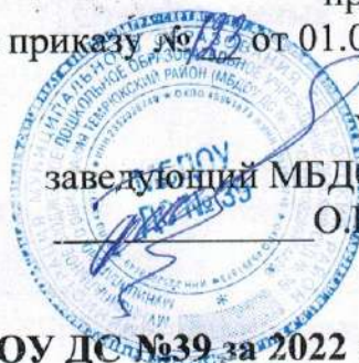
График проведения самообследования МБДОУ ДС №39 за 2022 год